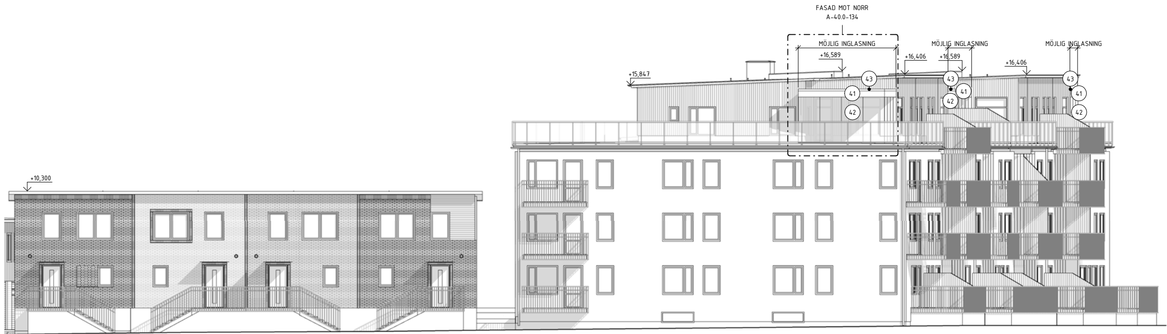
FASAD MOT NOTPLATSEN, DEL 2