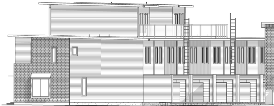
FASAD MOT NOTPLATSEN, DEL 1